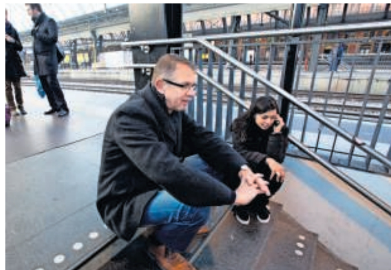
▲ In Deventer was er 89 keer een treinstoring in 2017. Van deze regio waren er alleen in Zwolle meer vertragingen.

Een storing wordt meegeteld op het moment dat NS een melding plaatst op de site en op informatieborden op stations. De storingsduur geeft hierbij aan hoe lang de trein niet volgens normale dienstregeling kan rijden en niet per se de vertraging die reizigers oplopen.